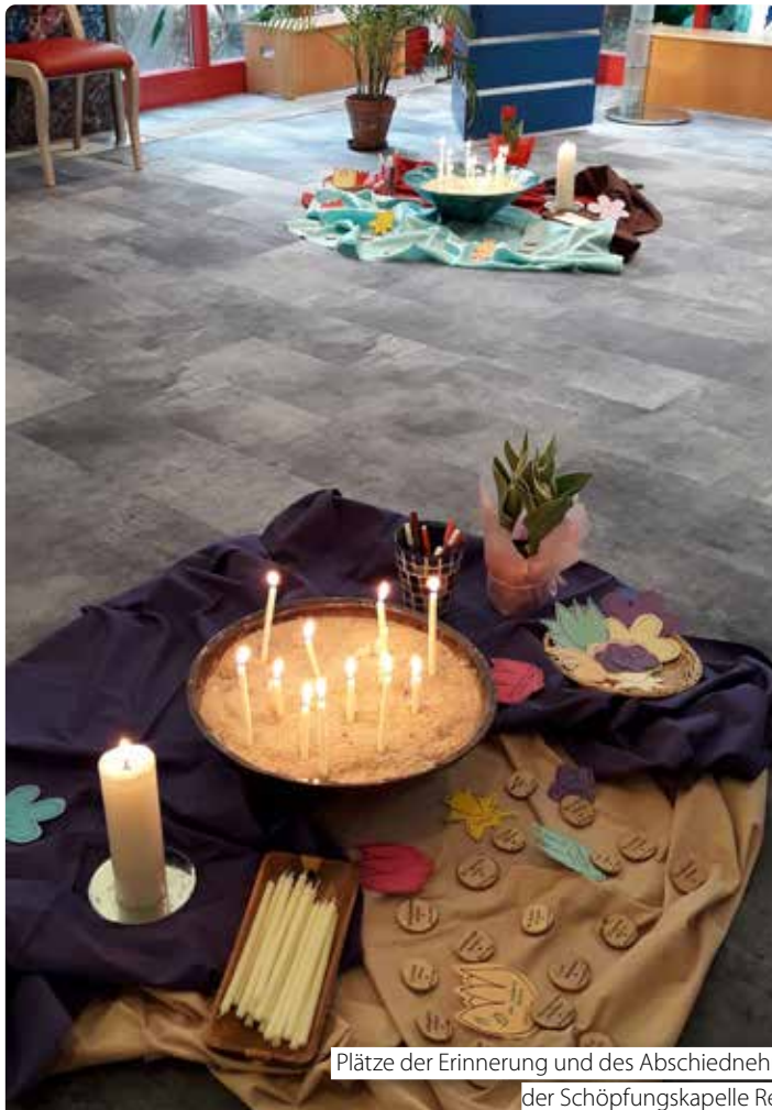
Plätze der Erinnerung und des Abschiednehmens in der Schöpfungskapelle Rennweg