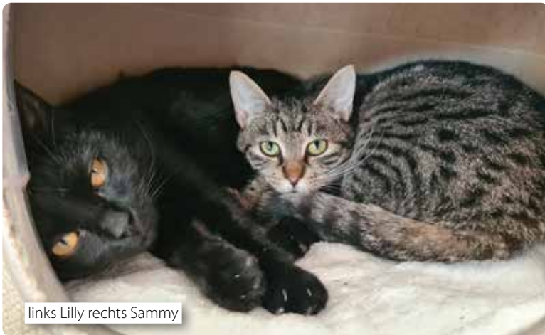
links Lilly rechts Sammy

Nachdem die beiden Katzen Mimi und Max nach vielen Jahren in Pension gegangen sind, gibt es seit Mitte Februar zwei neue Kätzchen im CS Hospiz Rennweg.