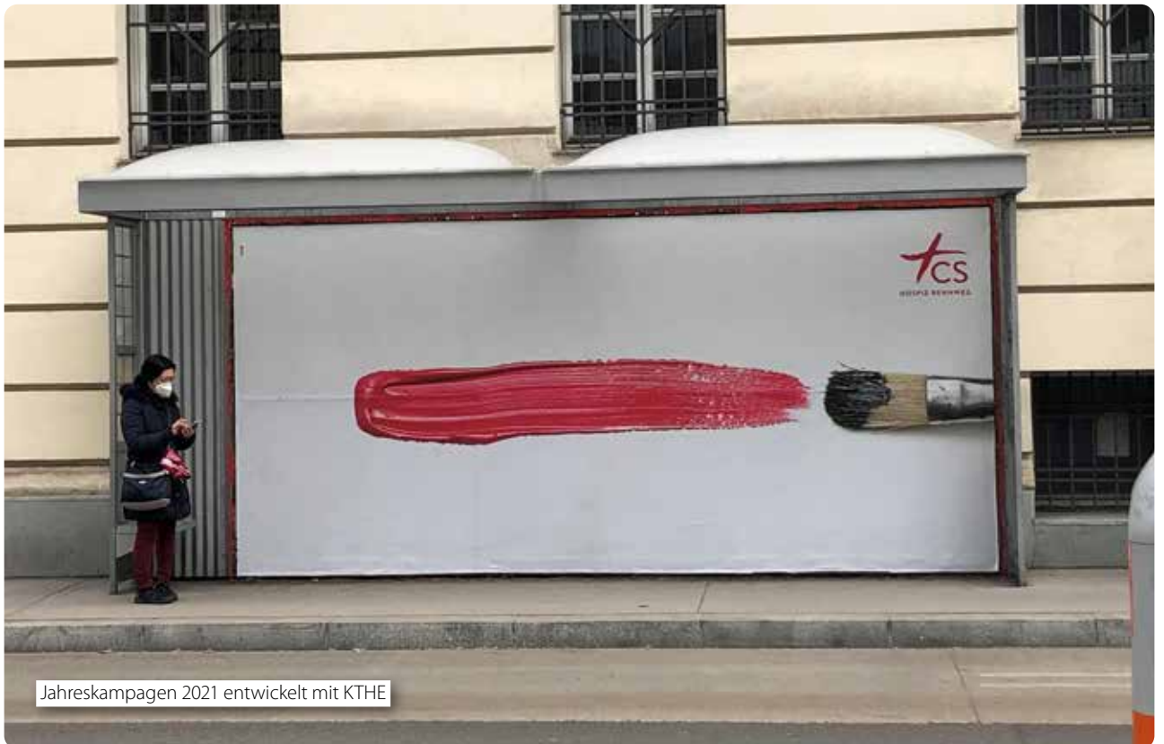
Jahreskampagnen 2021 entwickelt mit KTHE

Hätte Sterben eine Farbe, an welche denken wir zuerst? Schwarz, vermutlich. Aber warum kein beherztes Rot oder ein friedliches Gelb? Es ist immer noch ein Leben, es sind immer noch wir, die auch am Ende die Farben wählen. Der Angst und der Wut den Pinsel aus der Hand nehmen, umdenken, umfärben, Unbunt in Bunt verwandeln, sind Thema und Anliegen des CS Hospiz und der neuen Kampagne. Ist Schwarz der Definition nach die Abwesenheit von Farbe und Licht, so ist jetzt der richtige Zeitpunkt, die Fenster zu öffnen und den Farben Raum zu geben, dem Schwarz die Kraft zu nehmen.