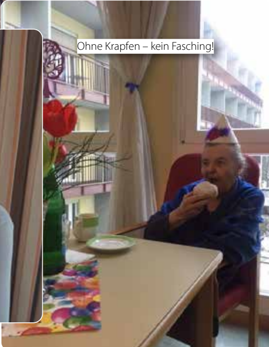
Ohne Krapfen – kein Fasching!