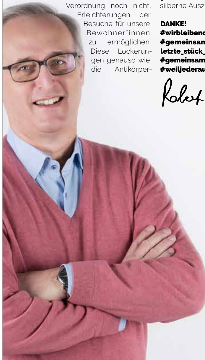
Geschäftsführer CS Caritas Socialis