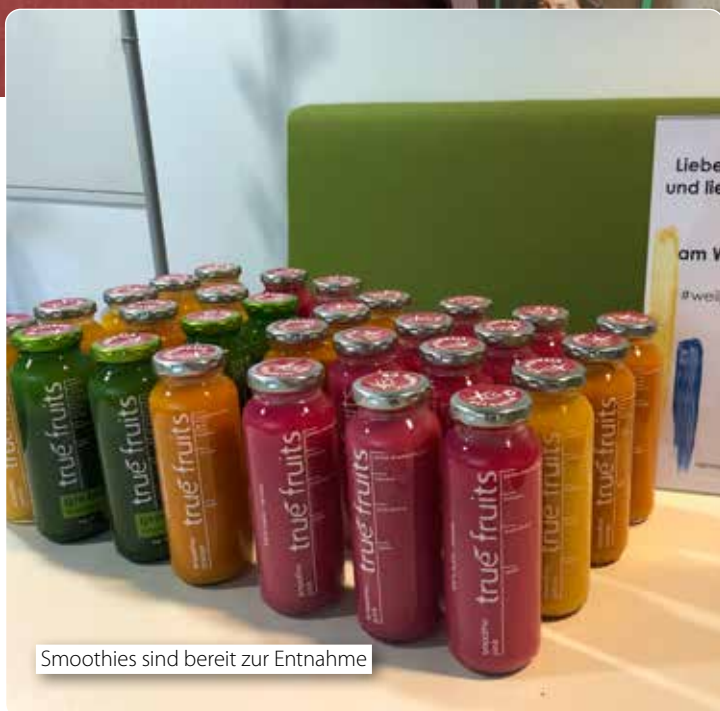
Smoothies sind bereit zur Entnahme