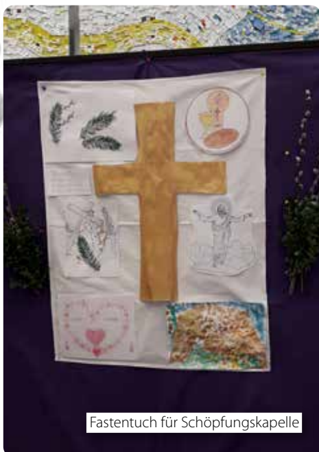
Fastentuch für Schöpfungskapelle