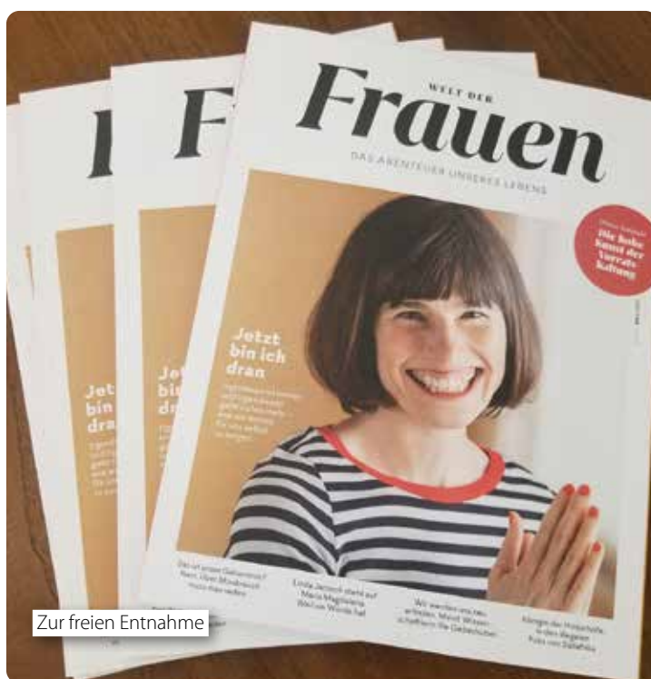
Zur freien Entnahme