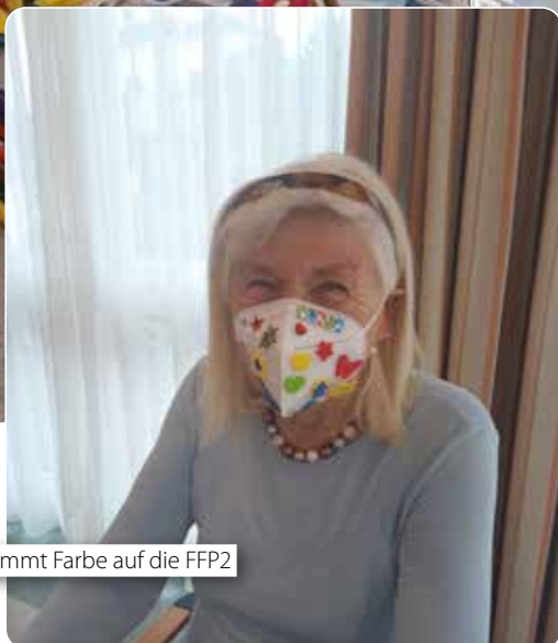
so kommt Farbe auf die FFP2

MILDE FISCH- ANTICORONA IMMUNITÄTSTÄRKENDE TIPPS FÜR Kardus - Vitamin A Zitrone - Vitamin C Klee - Vitamin C Apfel - Vitamin A, B, C Orange - Vitamin A, C COVID