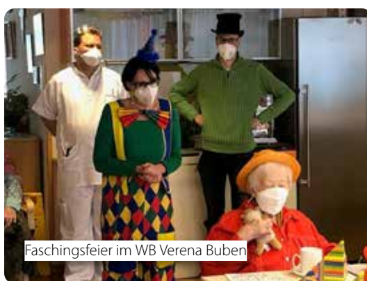
Faschingsfeier im WB Verena Buben